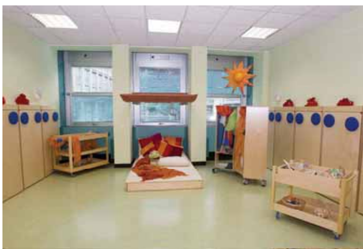
Un'area dell'Asilo Nido

L'Asilo e Marco Polo hanno ricevuto il Premio Simpatia nell'ambito della 36.a edizione del premio stesso. La cerimonia di premiazione si è svolta il 19 giugno nella Protomoteca del Campidoglio.