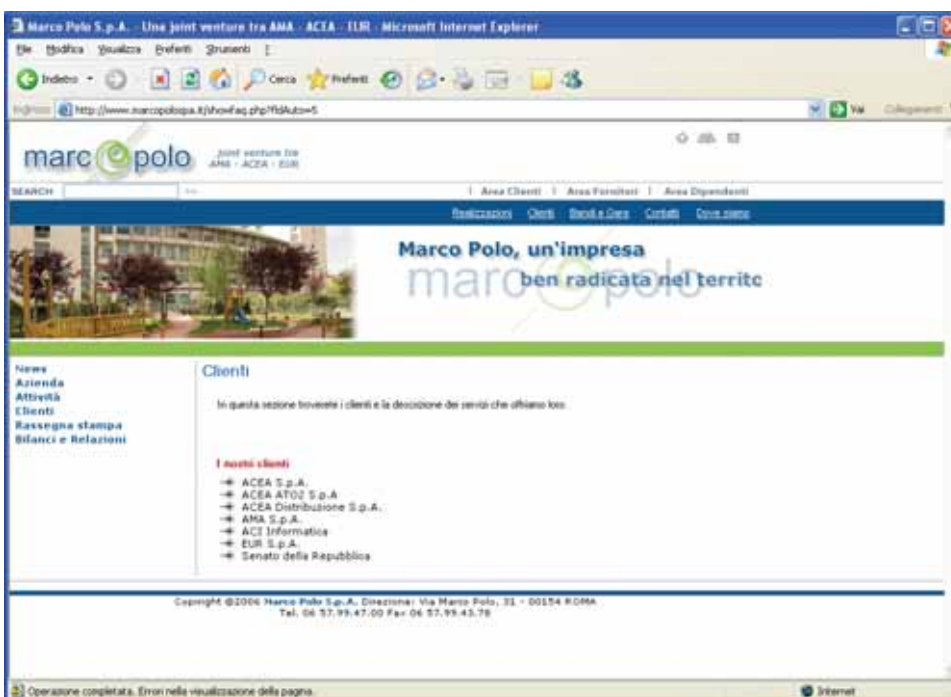
Sito Marco Polo - Area clienti