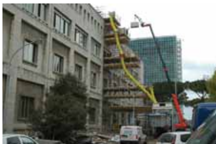
Il Cantiere di Via dell'Arte

a) la commessa di AceaElectrabel, che ha inciso nel primo semestre con un margine di € 823.994;