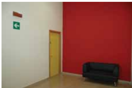
Un ambiente della nuova sede della JV

Il nuovo contratto di servizio per la sede della Joint Venture AceaElectrabel è stato quantificato in € 595.498 euro su base annua.