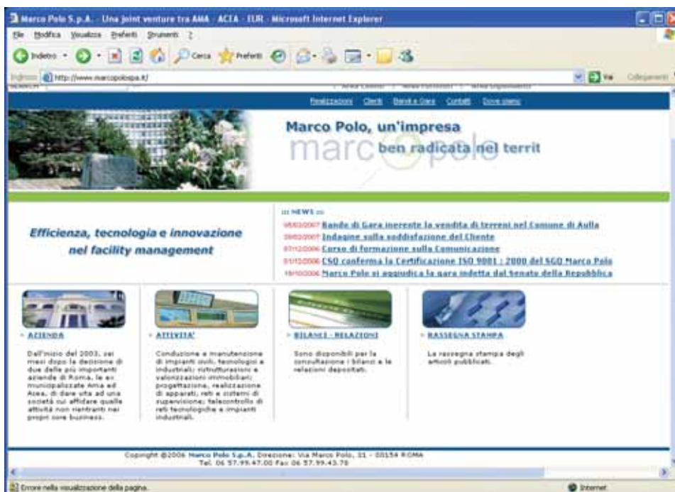
Il sito Marco Polo