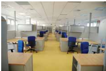
Gli spazi ristrutturati del 9° piano Sede della ACEA

Con separata contrattualizzazione (emissione ed accettazione preventivo, emissione ed accettazione ordine), sono state erogate prestazioni di lavori a favore di ACEA per un totale di € 494.500, ovvero 320.000 euro per la ristrutturazione del 9° piano della sede di P.le Ostiense e 174.500 per la realizzazione dell'Asilo Nido.